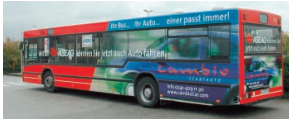
cambio Aachen und der Verkehrsbetrieb ASEAG: Gemeinsame Marketing-Kampagne mit Modellcharakter

cambio Aachen wurde ausgewählt an einer »Pilotstudie zur Modellierung einer Schnittstelle zwischen ÖPNV und CarSharing« im Auftrag des Bundesministeriums für Verkehr, Bau- und Wohnungswesen teilzunehmen. Im Rahmen dieser Studie führten cambio Aachen und die ASEAG, der Aachener Verkehrsbetrieb, von Oktober 2001 bis März 2002 eine gemeinsame Werbekampagne durch. Wem also im Aachener Stadtbild der Sätze ins Auge sprangen: »Ihr Bus + Ihr Auto – einer passt immer!« oder »Mit der ASEAG können Sie jetzt auch Auto fahren« – der weiß, dass cambio dahinter steckt. Das besondere Angebot dieser Kampagne richtete sich vor allem an diejenigen, die die Vorteile der Kombination von Bus und Stadtauto während einer dreimonatigen Testphase einmal ausprobieren wollten. Von den 54 Testpersonen waren 41 Neueinsteiger bei cambio und ausnahmslos alle blieben auch nach der Testphase cambio-Kunden. Die Universität Kaiserslautern untersucht den Erfolg der Aachener Öffentlichkeitsarbeit, um daraus Empfehlungen für andere Städte zu entwickeln. gw