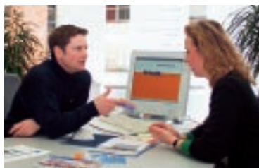
Vorbildliche Zusammenarbeit in Bielefeld: Im jüngst gemeinsam bezogenen MoBiel-Haus beraten Mitarbeiter der Verkehrsbetriebe auch zum Thema CarSharing - bis hin zum Vertragsabschluss