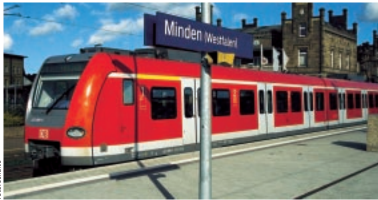
Bestellung von Zugleistungen – hier die S-Bahn Minden-Hannover – gehören zu den Aufgaben des VVOWL.

Der VVOWL finanziert den Schienenpersonennahverkehr in den Kreisen Gütersloh, Herford, Minden-Lübbecke und Lippe sowie in der Stadt Bielefeld, setzt sich für dessen Verbesserungen ein und koordiniert auch die Verknüpfungen zwischen den Verkehrsmitteln. Gerade in den ländlichen Räumen