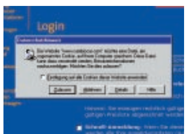
Den cambio-Cookie müssen Sie unbedingt zulassen – sonst wird's nichts mit der Buchung ...

Nur wenn Cookies zugelassen sind funktioniert die Web-Buchung. Wie Sie hierfür die entsprechenden Sicherheits-Einstellungen Ihres Browsers konfigurieren, erfahren Sie im Bereich »Häufige Fragen« der cambio Website. oy