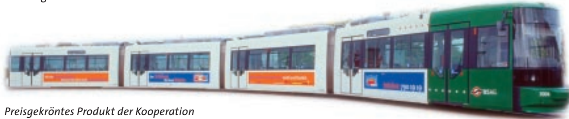
Preisgekröntes Produkt der Kooperation von cambio und BSAG: die Bremer Karte plus AutoCard

* Die Bremer AutoCard gilt in Verbindung mit dem Erwerb der »BremerKarte« und kann auch einzeln (also außerhalb eines Abos) bezogen werden.