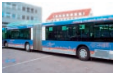
Unterstützte den Start von cambio auch finanziell: Die Saarbrücker Verkehrsbetriebe Saarbahn plus Bus