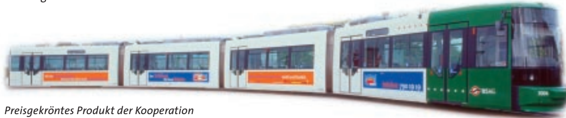
Preisgekröntes Produkt der Kooperation von cambio und BSAG: die Bremer Karte plus AutoCard

* Die Bremer AutoCard gilt in Verbindung mit dem Erwerb der »BremerKarte« und kann auch einzeln (also außerhalb eines Abos) bezogen werden.