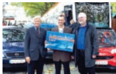
Herbst 2000: Auftakt der gemeinsamen Aktion »Clever mobil« von cambio und den Kölner Verkehrsbetrieben KVB

noch sehr stark eingeschränkt. Bus-, Tram- und Taxifahrt mit ein und derselben Chipkarte bezahlen, die obendrein das CarSharing-Auto öffnet – das ist leider bislang ein frommer Wunsch geblieben.