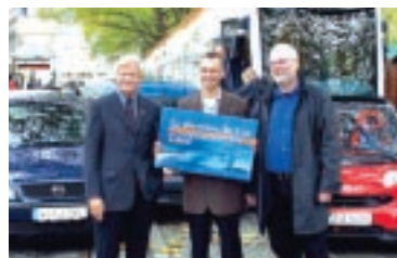
Herbst 2000: Auftakt der gemeinsamen Aktion »Clever mobil« von cambio und den Kölner Verkehrsbetrieben KVB

noch sehr stark eingeschränkt. Bus-, Tram- und Taxifahrt mit ein und derselben Chipkarte bezahlen, die obendrein das CarSharing-Auto öffnet – das ist leider bislang ein frommer Wunsch geblieben.